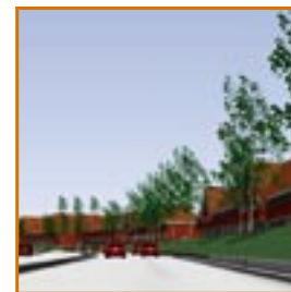
Parkeren zoveel mogelijk uit het zicht